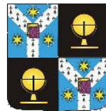
Departamentul de Geografie, Facultatea de Geografie și Geologie, UAIC, Iași

Asociația Envirogis Iași https://www.facebook.com/envirogis