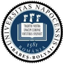
Universitatea "Babeș- Bolyai" din Cluj- Napoca, România