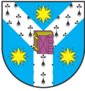
Universitatea "Alexandru Ioan Cuza" din Iași, România